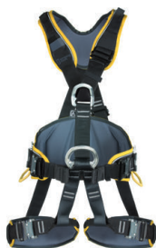
PROFI WORKER 3D STANDARD