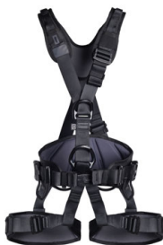
PROFI WORKER 3D STANDARD black