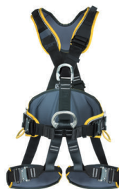
PROFI WORKER 3D SPEED