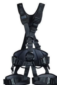
PROFI WORKER 3D SPEED black