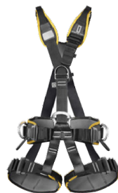
PROFI WORKER III